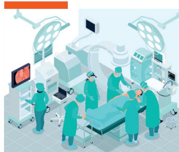
table atout et en théorie, il est donc impossible de fermer l'établissement. Gérer 13 000 urgences de plus sur Perpignan serait une véritable catastrophe. L'ARS fera tout ce qui est possible pour maintenir l'ouverture. Il n'y a pas de raison qu'on ferme. La chirurgie ne fermera pas, de même que l'imagerie, car ce sont des services rentables d'un point de vue financier pour le groupe Elsan. Tant qu'il y a des médecins, il n'y a pas de soucis à se faire. L'inquiétude, s'il devait y en avoir une, serait plutôt de ce côté-là. Comme partout.

Céret accueille 13 000 passages aux urgences par an. C'est un véri-