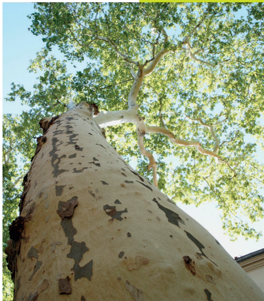
| L'adaptation de l'arbre au stress hydrique