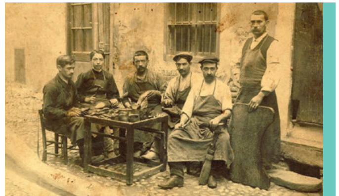
Un jeu de piste sur les commerces d'autrefois

L'édition 2023 fera la part belle aux commerces d'autrefois au travers d'un jeu de piste pensé comme une plongée dans l'histoire de Céret.