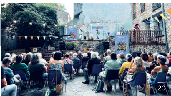
21/22 - 39 e édition de la ronde céretane le 17 septembre