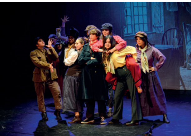
Comédie musicale Oliver Twist / Irvem P.O

« La culture pour tous et à petits prix ». Voici le slogan qui s'imposerait si l'on devait résumer la programmation de la saison à venir. La commission culturelle et le pôle culture ont travaillé dans l'optique de proposer une programmation éclectique, colorée et attirante : 13 spectacles dont 3 scolaires ; soit 10 rendez-vous répartis entre le vendredi 6 octobre 2023 et le 3 mai 2024.