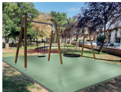
Tyrolienne et balançoires en nid d'oiseau