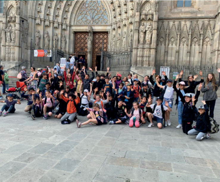
Les élèves bilingues à la cathédrale de Barcelone