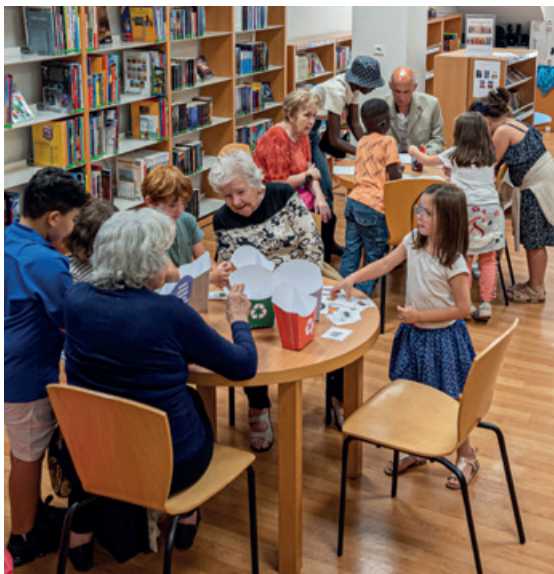
Atelier intergénérationnel à la médiathèque / 2022