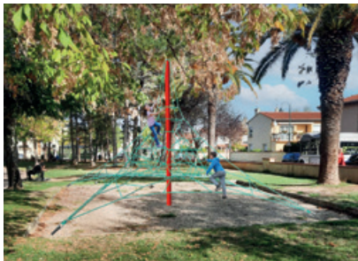
Nouvelle toile d'araignée

Des modules flambants neufs vont bientôt être installés dans le principal parc de jeux pour enfants de Cérét. Les anciens agrésés, vieillissants et abîmés, avaient peu à peu été enlevés au cours des années et leurs emplacements étaient restés béants. Ils vont donc désormais être comblés par du mobilier moderne qui sera installé avant la fin de l'année.