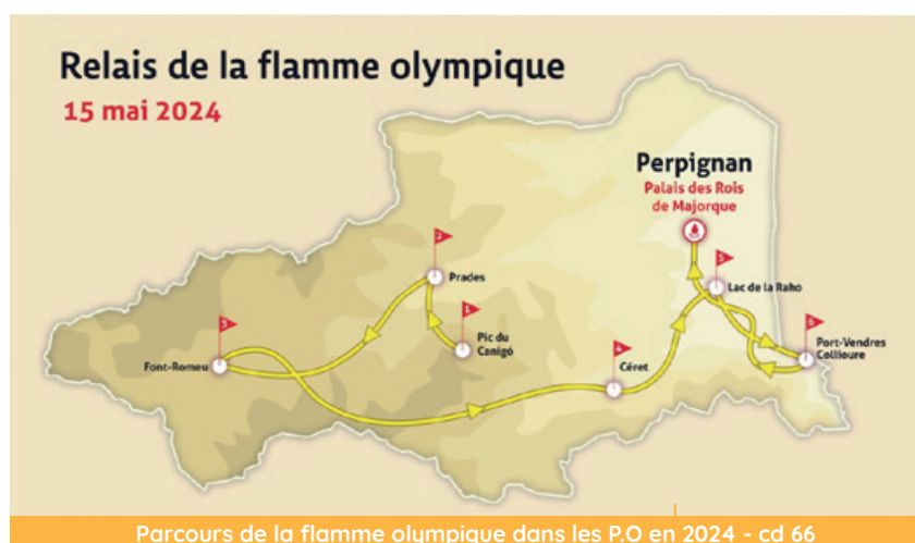
Parcours de la flamme olympique dans les P.O en 2024 - cd 66

C'est vraiment un beau message que l'on fait passer sur les valeurs du sport et le message de paix". La présidente insiste également sur la logistique d'un tel événement : "C'est une grosse structure, une caravane presque comme celle du Tour de France. Et on aura une centaine de porteurs de flamme, dont six emblématiques". Leurs noms seront prochainement dévoilés. A eux de faire briller la flamme de mille feux.