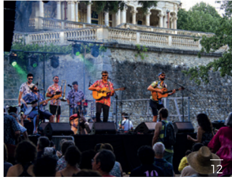
12 - 2 nd édition du festival Coblissim au Parc du Château d'Aubiry le vendredi 28 juillet