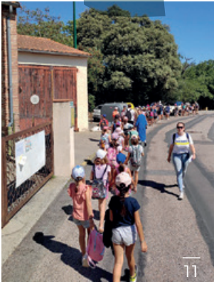
11 - Sortie cabane du centre de loisirs cet été