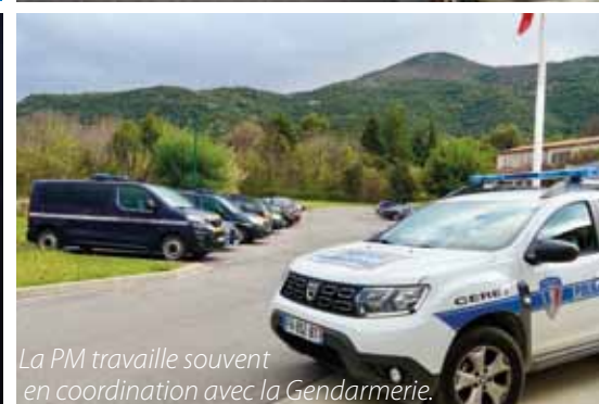
La PM travaille souvent en coordination avec la Gendarmerie.

Une nouvelle ère. A Céret, les effectifs de la Police Municipale (PM) sont aujourd'hui de 6 agents (dont deux policières) et 2 ASVP (agents de sécurité sur la voie publique) qui se répartissent un large éventail de tâches. Leurs missions relevant aussi bien de la surveillance du bon ordre que de la sécurité urbaine : circulation, sortie des écoles, balisage pour les travaux, les déménagements, patrouilles de proximité pédestres ou en VTT.