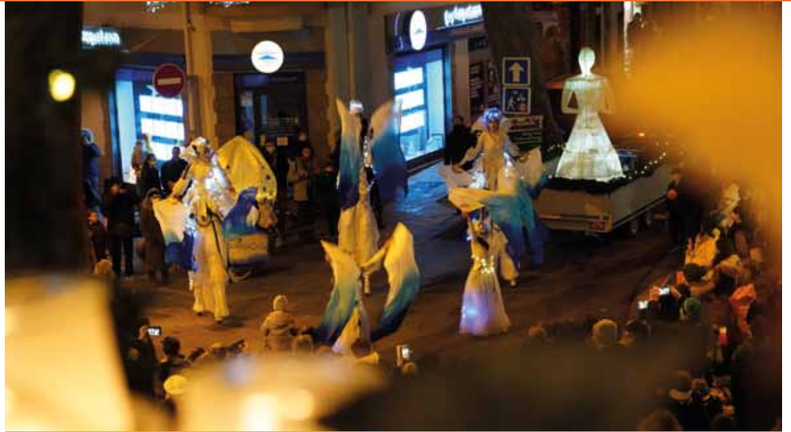
La Festa de la Llum et la déambulation de la parade des lumières à travers la ville.