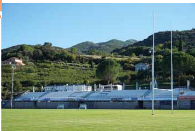
Le stade Fondecave, désormais découvert. Des projets de réaménagement seront soumis à concertation.