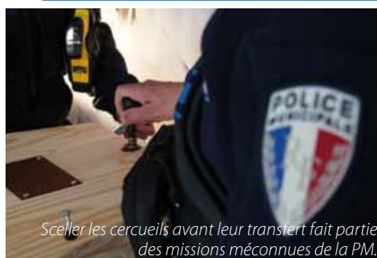
Sceller les cercueils avant leur transfert fait partie des missions méconnues de la PM.