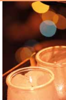
Ambiance lumineuse et féérique de la Festa de la Llum.