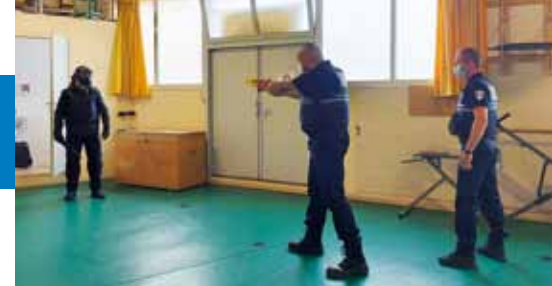
Les agents sont formés au maniement du taser.