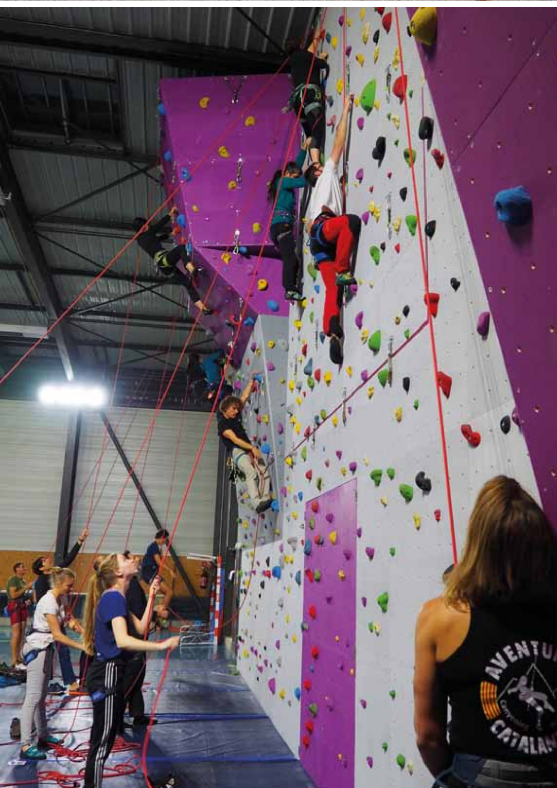
Le mur d'escalade a pu être construit grâce aux subventions de différents acteurs publics.