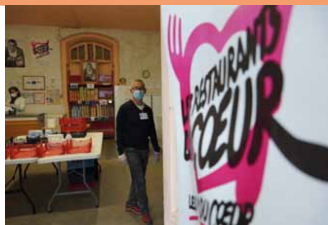
En raison de la pandémie, 2021 aura été une année intense pour les Restos du cœur qui ont vu leur fréquentation, hélas, bondir.