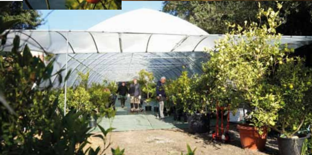
Les agrumes sont entreposés dans une serre spécialement aménagée .