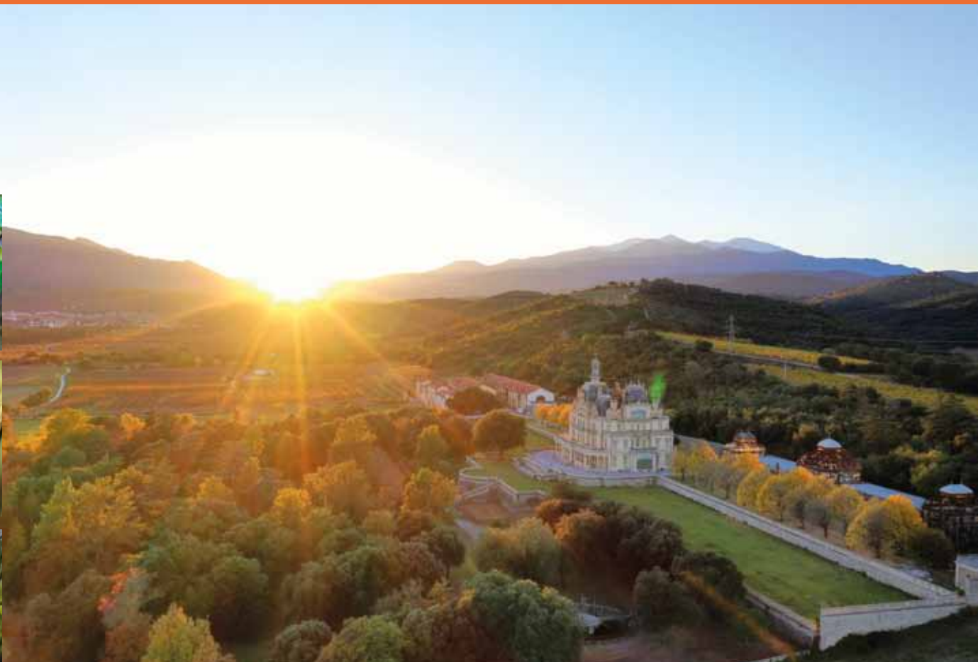
La collection d'agrumes acquise par la Ville sera bientôt accessible au public dans le parc du château d'Aubiry.