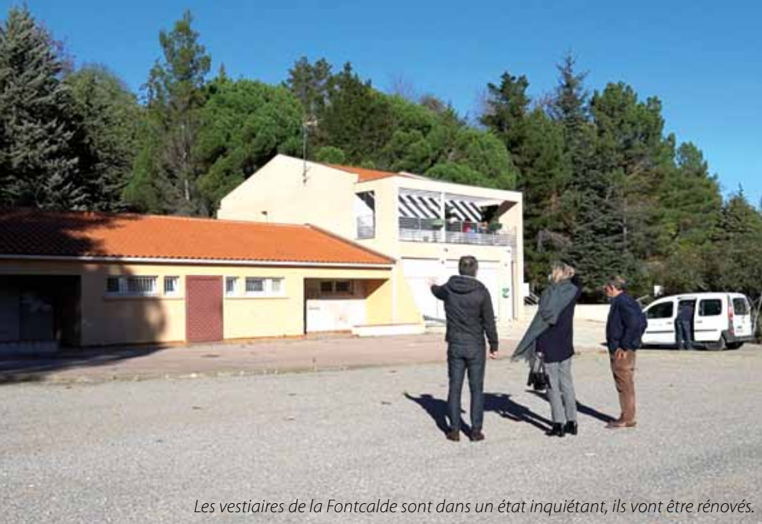
Les vestiaires de la Fontcalde sont dans un état inquiétant, ils vont être rénovés.