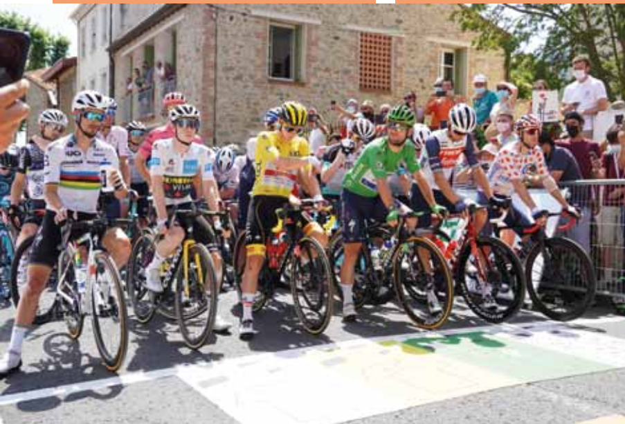
Le 11 juillet restera une date gravée dans l'Histoire de Céret, ville départ de la 14 e étape du Tour de France.