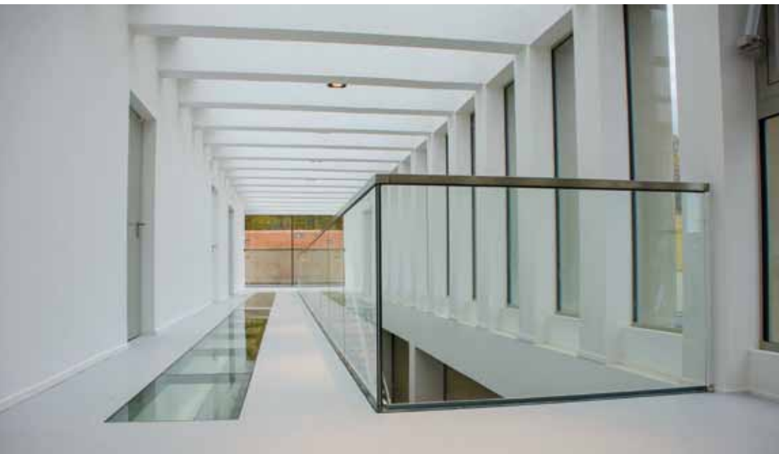
Comme dans la partie historique, la lumière du jour est ici présente partout.