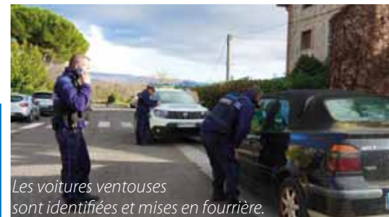
Les voitures ventouses sont identifiées et mises en fourrière.

La Police Municipale se transforme et se modernise.