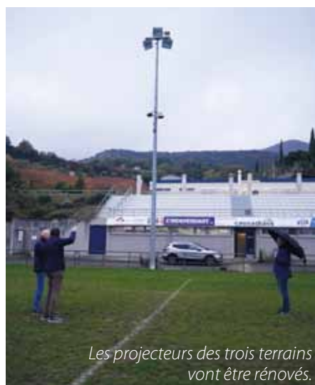
Les projecteurs des trois terrains vont être rénovés.