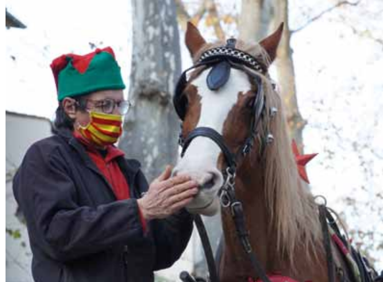
Le père Noël, son lutin, son cheval et sa calèche ont sillonné les rues de Céret.