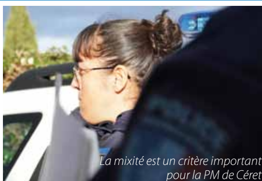
La mixité est un critère important pour la PM de Céret