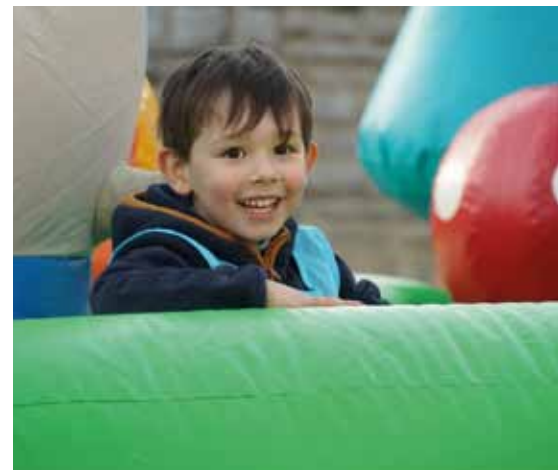
Les animations de Noël et notamment les châteaux gonflables ont ravi les enfants.