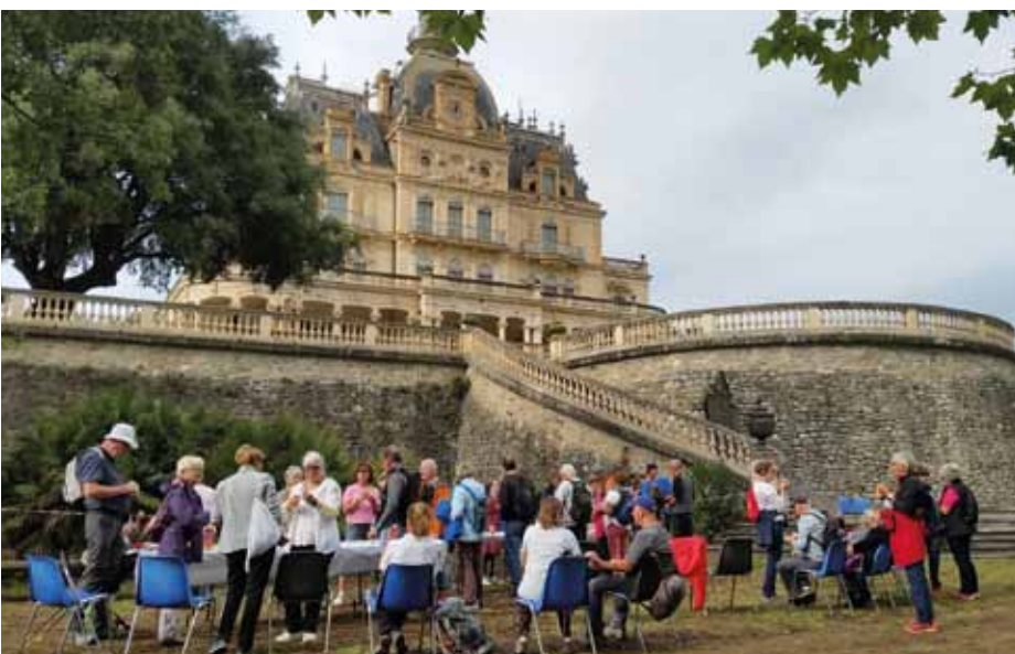
La Marche bleue organisée par le CCAS, qui a été un grand succès, a été l'occasion pour nos séniors de découvrir le parc d'Aubiry. Prometteur pour les années à venir.